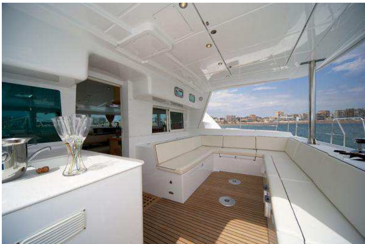
Lagoon 440