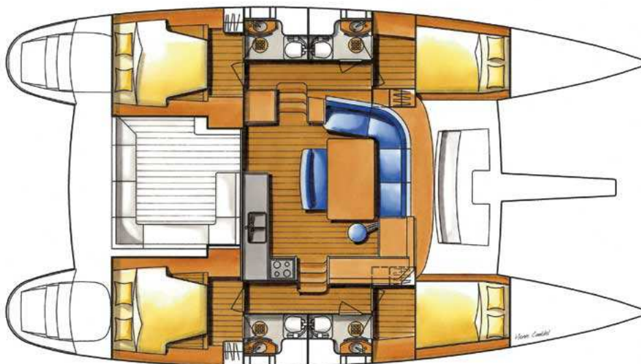
LAGOON 440 version charter