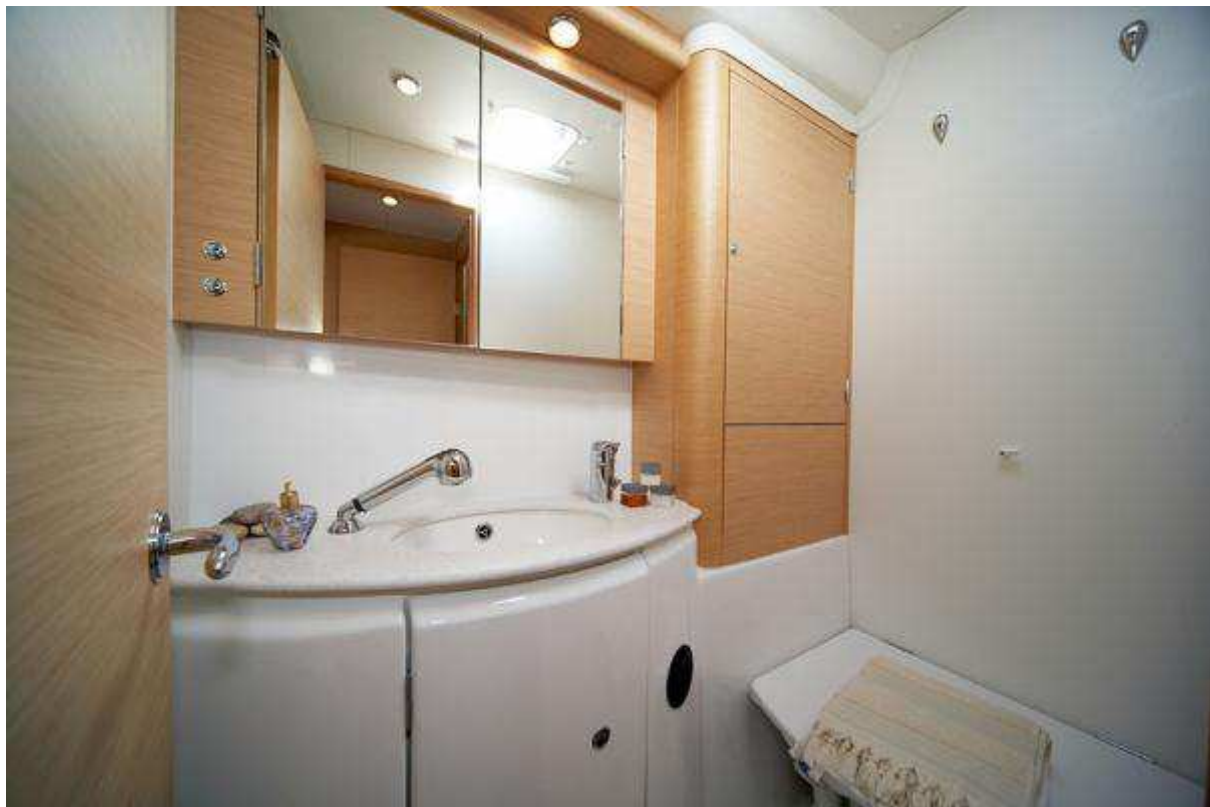
Lagoon 440