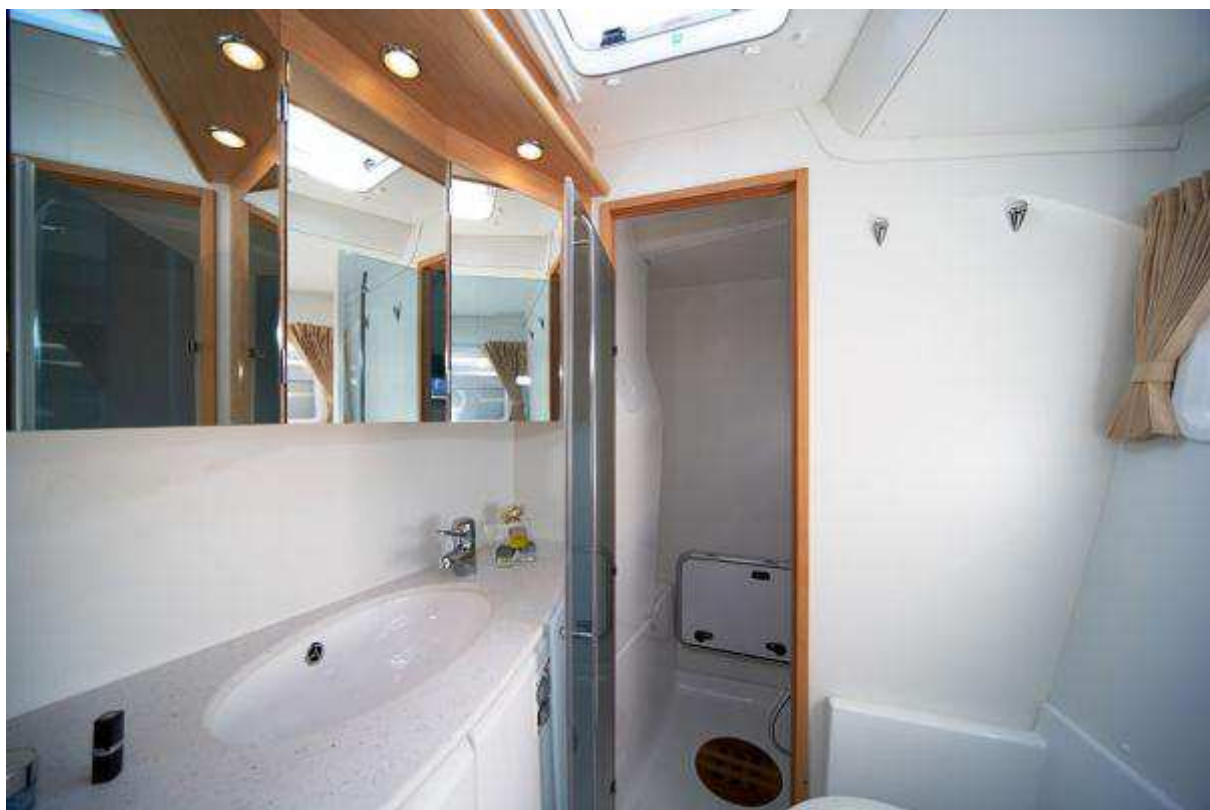
Lagoon 440