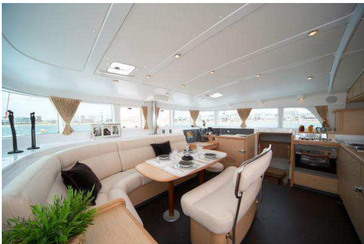
Lagoon 440